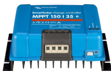
Contrôleur de charge SmartSolar MPPT 150/35